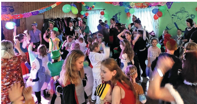
Impressionen aus dem vergangenen Jahr

Am 13. Februar 2024 geht es wieder von 16:16 Uhr bis 18:18 Uhr im Jugendclub zum Kinderfasching zur Sache. Bei freiem Eintritt können die Kinder, natürlich mit ihren Eltern und Großeltern, das närrische Fest so richtig toll genießen. Auch die bei den Kindern so beliebten zwei kleinen Mäuse werden sich wieder unter die Gästeschaar mischen und für Stimmung sorgen. Traditionell muss jedes Kind, das an der Feier teilnehmen möchte, über die kleine Rutsche in den Saal kommen. Hier gibt es für jeden, der das mit Bravour meistert, eine Kleinigkeit als Belohnung.