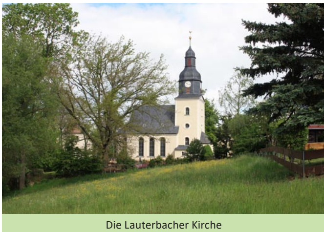
Die Lauterbacher Kirche

Als das Herz einer Kirche könnte man die Läuteanlage, oder verständlicher gesagt die Kirchturmglocken, bezeichnen. Auf die Glocken der Lauterbacher Kirche kommt in Kürze eine umfassende Überholung zu. Diese Maßnahme reiht sich in die seit vielen Jahren laufenden Werterhaltungsmaßnahmen des Gotteshauses ein. Alle drei Glocken wurden in den 1920er Jahren geweiht und überlebten beide Weltkriege, wurden also nicht eingeschmolzen.