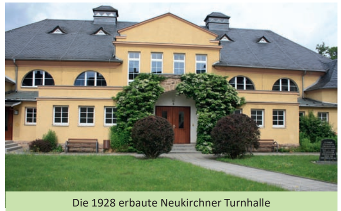
Die 1928 erbaute Neukirchner Turnhalle

Betrachtet man den Belegungsplan der Neukirchener Turnhalle in der Hauptstraße 6, muss man feststellen, dass diese mit 90 % fast ausgebucht ist. Als Schulturnhalle des Landschulzentrums ist die sportliche Einrichtung ideal.